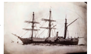
Nordenskiölds Vega-expedition (1878–80). Övervintring i Sibirien.

Välkommen till Kunskapens Hus på ön Lappo mitt i Skärgårdshavet. Vi förevisar ett stort antal modellskepp från äldre tider fram till nutid. Kom gärna på besök. Kunskapens Hus ligger ca. 600 m från hamnen, skyltar visar vägen.